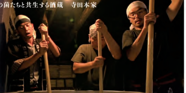
土地の菌たちと共生する酒蔵 寺田本家